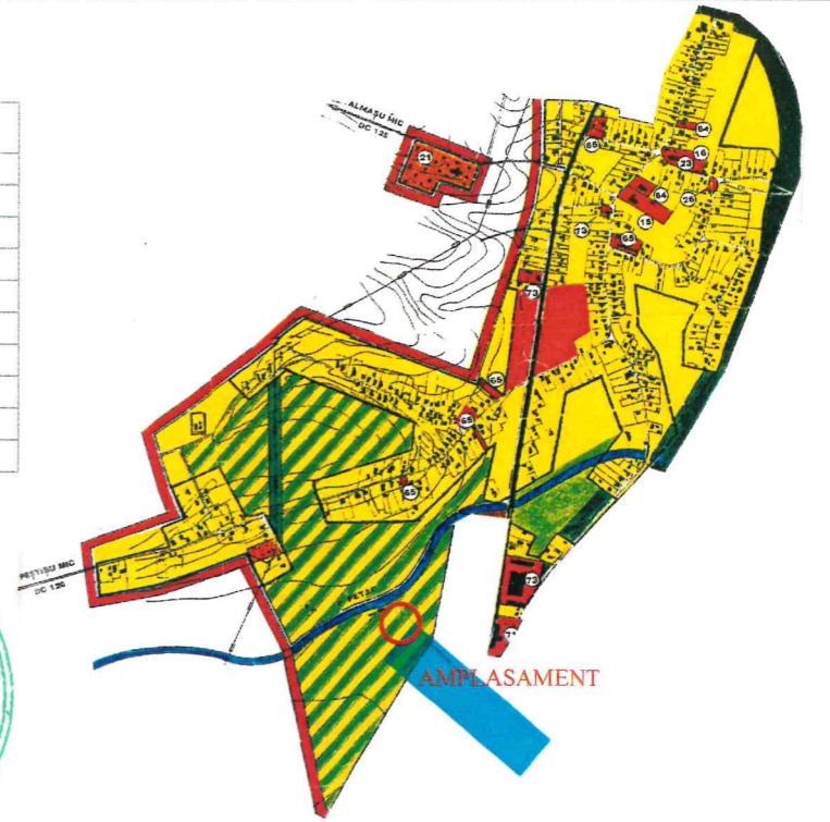
INCADRARE IN ZONA