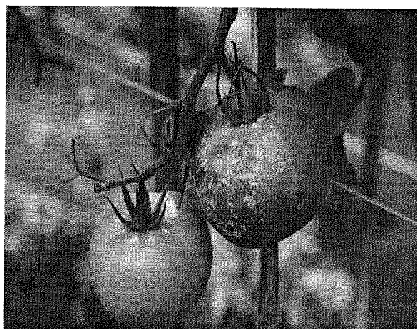
Atac pe fructe