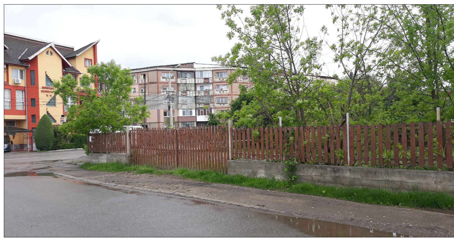
Imagine dinspre accesul existent

DISFUNCTIONALITATI: Neconcordanta intre functiunea propusa - construire spalatorie auto si imprejmuire proprietate - si functiunea stabilita prin P.U.G. - UTR 4, anume zona gospodarii individuale si functiuni complementare.