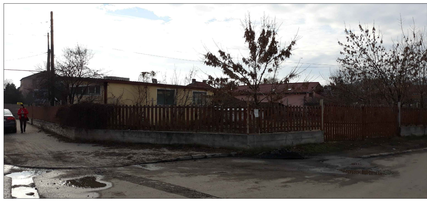
Imagine dinspre Bulevardul Traian