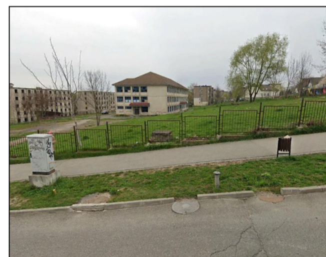
TABLOUL ARIILOR EXISTENT: Suprafata teren studiat: 6.744,00 mp

BENEFICIAR: MUNICIPIUL HUNEDOARA PROPRIETAR TEREN: MUNICIPIUL HUNEDOARA ADRESA AMPLASAMENT: Municipiul Hunedoara, str. Alexandru Vlahuta, nr. 16D CF 76453, nr. cad./topo. 76453; Suprafata teren conf. CF: 6.744,00 mp; Folosinta conf. CF - curti constructii; Teren intravilan imprejmuit partial;