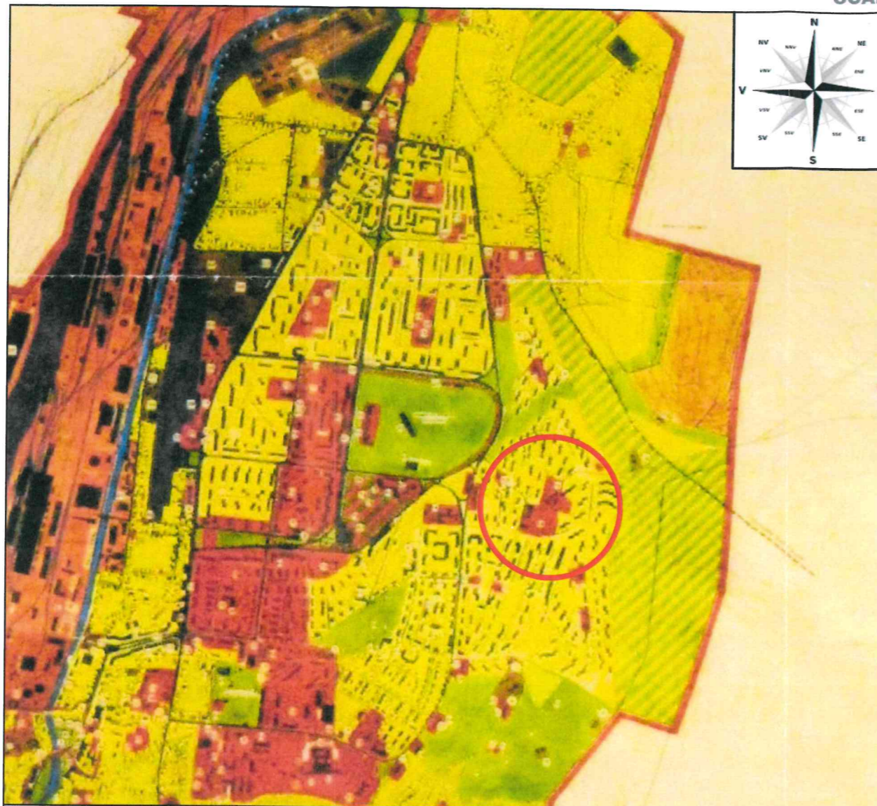
EXTRAS PUG aprobat Municipiul Hunedoara - SCARA 1:5000

Conform PUG aprobat cu HCL 91/1999 si prelungit cu HCL 485/2018 terenul studiat se afla in UTR 2 - alte zone cu functiuni complexe de interes public