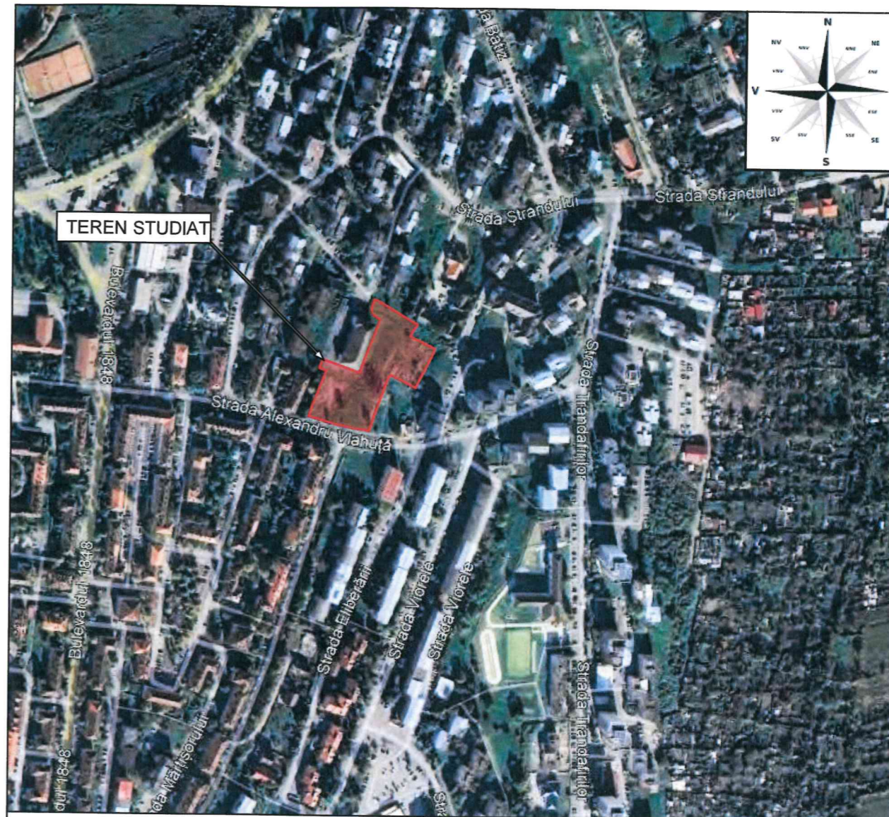
PLAN DE SITUATIE ORTOFOTOPLAN - SCARA 1:2000

Conform PUG aprobat cu HCL 91/1999 si prelungit cu HCL 485/2018 terenul studiat se afla in UTR 2 - alte zone cu functiuni complexe de interes public