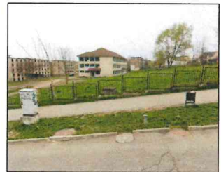
TABLEAUL ARIILOR EXISTENT: Suprafata teren studiat: 6.744,00 mp

BENEFICIAR: MUNIICIPIUL HUNEDOARA PROPRIETAR TEREN: MUNIICIPIUL HUNEDOARA ADRESA AMPLASAMENT: Municipiul Hunedoara, str. Alexandru Vlahuta, nr. 16D CF 76453, nr. cad./topo. 76453; Suprafata teren conf. CF: 6.744,00 mp; Folosinta conf. CF - curti constructii; Teren intravilan imprejmuat partial;